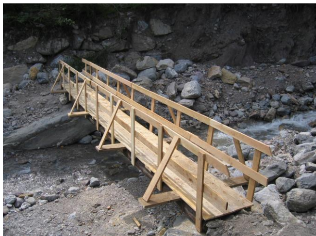
neue Brücke über den Gasilbach