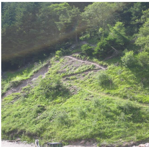
neuer Weg zum Gasilbach

Die Quelle ist somit für alle wieder erreichbar!